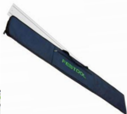
BONUS FS 800/2, sina de ghidare, cod 491499 FS-BAG, husa, cod 466357