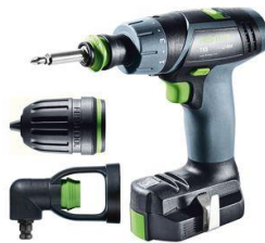
SAU TXS Li 2,6-Set masini de gaurit si insurubat cu acumulatori, cod 564510