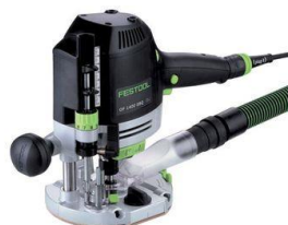
OF 1400 EBQ-Plus, masina de frezat, cod 574341