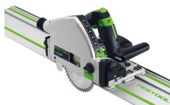
TS 55 REBQ-Plus-FS, ferastrau circular, cod 561580