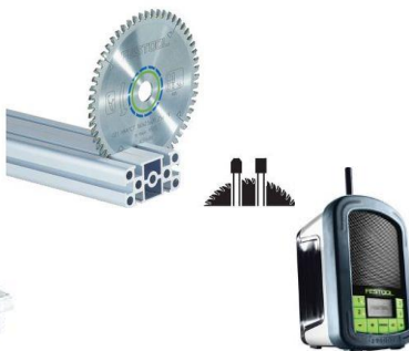
BONUS 260x2,4x30 TF68, panza speciala de ferastrau, cod 494607 SYSROCK, BR10, Aparat radio pentru șantier, cod 200183