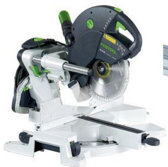
KAPEX, KS 120 EB ferastrau circular stationar, cod 561283