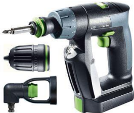
CXS Li 2,6-Set, cod 564532