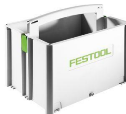
BONUS SYS-TB-2, toolbox, cod 499550